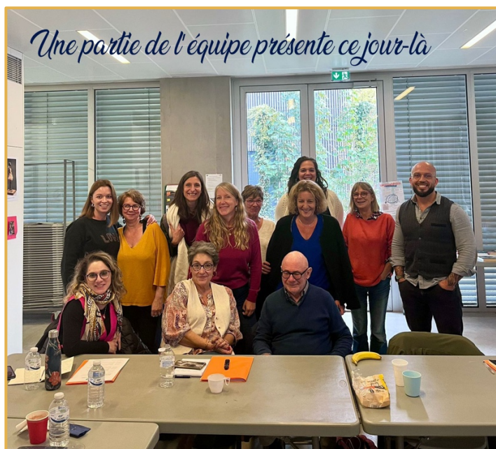
Le reste de l'équipe est caché derrière l'appareil ;)

Cette année c'était en septembre avec un programme riche qui a découlé sur de nouvelles mises en œuvre (notamment les post-it – cf. p.13) et de nouvelles perspectives de formation pour répondre aux besoins de développement de l'association qui auront lieu en 2026.