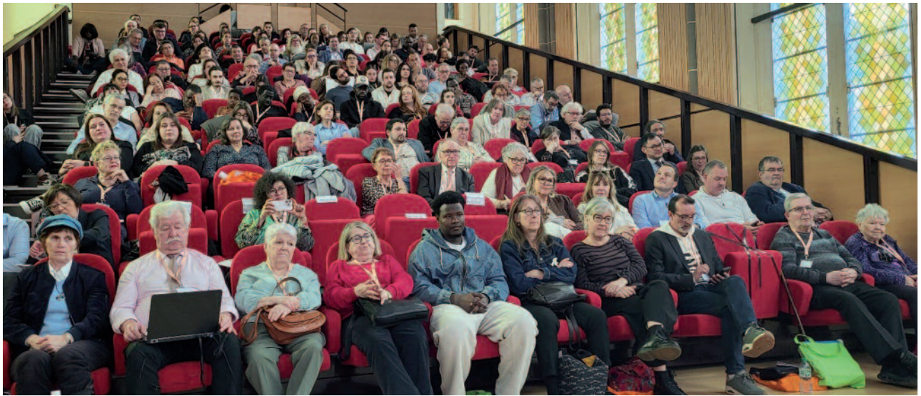
L'assemblée générale du dimanche matin.

Le chiffre marquant : 160 représentations dans les instances nationales au cours de l'année contre 152 en 2024 et 47 en 2016. Une progression qui témoigne du chemin parcouru et de la place désormais reconnue à la fédération dans les débats publics.