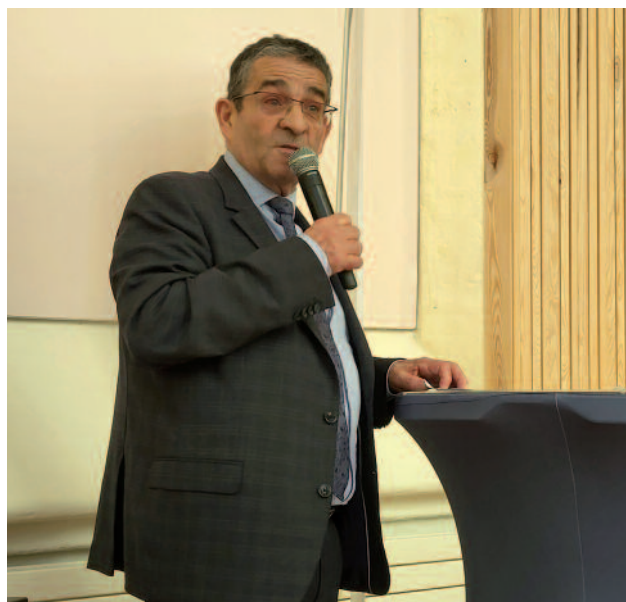
Le président Jean-Marie Muller lors de son rapport moral.

Pour autant, le président ne cède pas à l'autosatisfaction. L'actualité législative méritait attention. Deux textes étaient dans les tuyaux au moment du congrès : une proposition de loi d'initiative parlementaire sur l'intérêt de l'enfant, adoptée en janvier à l'unanimité des trente-cinq députés présents, - ce que le président com-