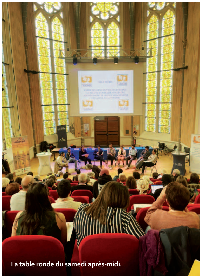
La table ronde du samedi après-midi.